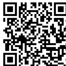
Проект договора для юр. лица