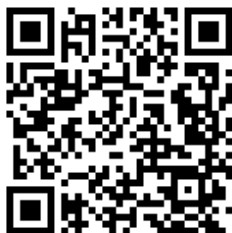
Учебно- методический план