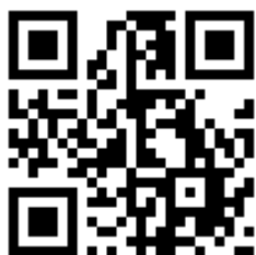
Запись на обучение

Для записи на обучение Вы можете заполнить заявку на обучение по ссылке https://oatos.ru/edu или сразу перейти к заполнению договора: