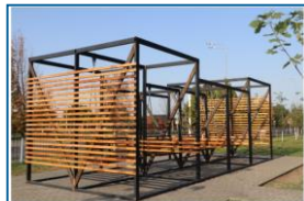
Парковые качели отражают традиции древней чеченской архитектуры – вайнахского жилого комплекса