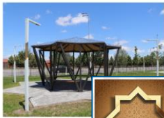
БЕСЕДКА В СТИЛЕ РУБ АЛЬ ХИБАЗ

Разработка и создание функциональных объектов для благоустройства с использованием элементов местной идентичности