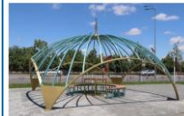
Беседка выполнена в стиле одной из красивейших мечетей мира, которая находится в г. Аргун и является визитной карточкой города